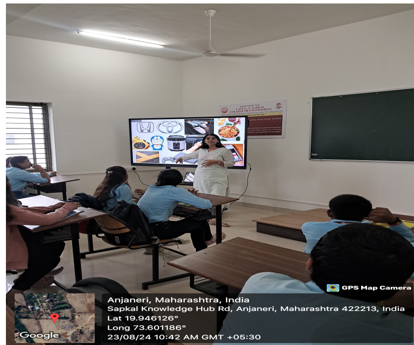
Competitive exam guidance session by Alumni